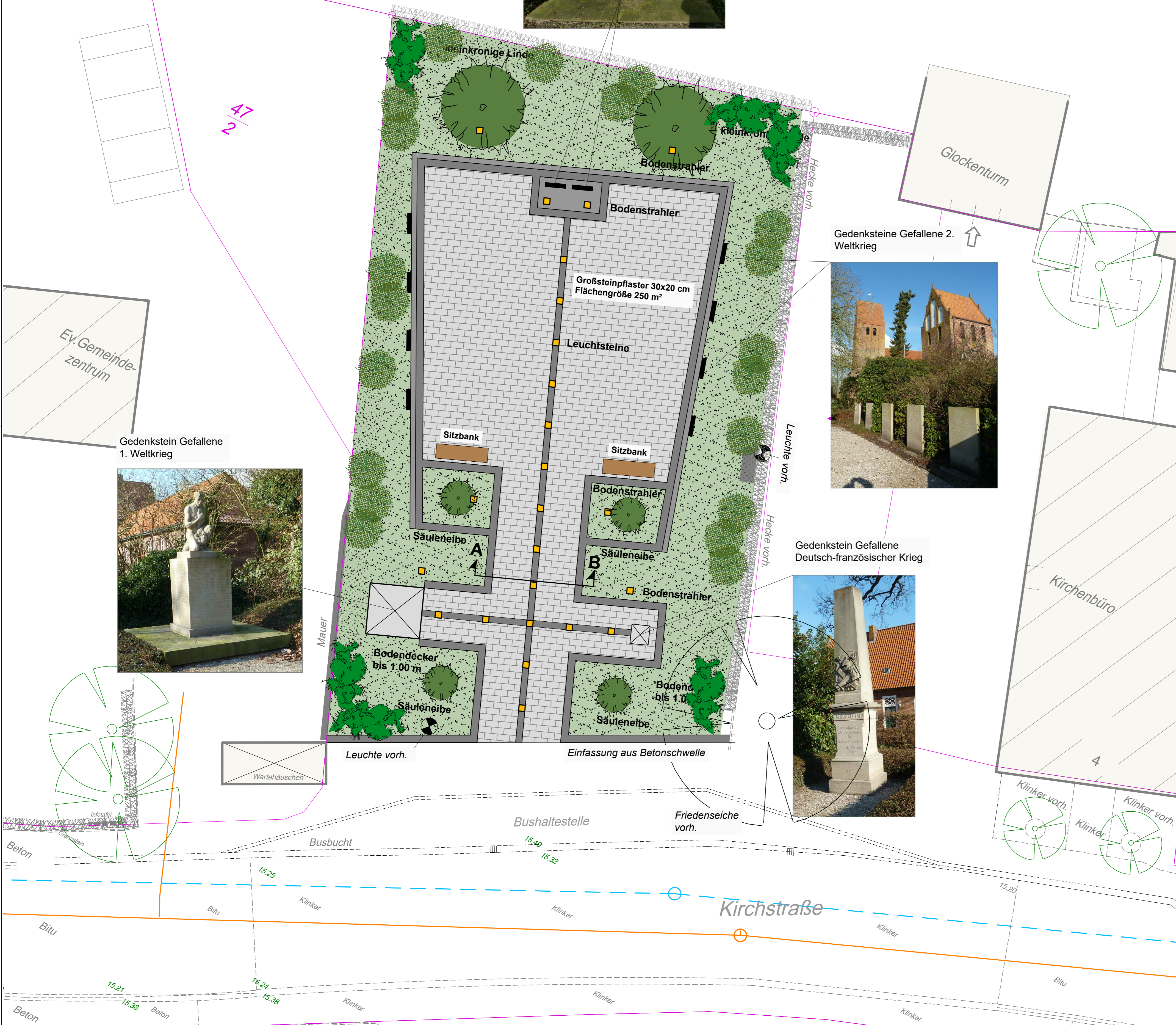
Gedenkstein Gefallene 1. Weltkrieg