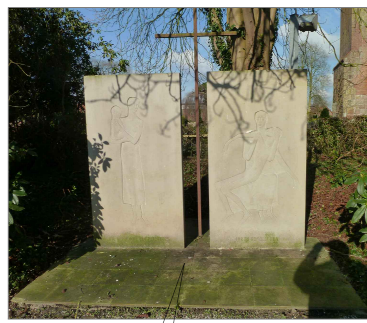
Ehrenal Gedenksteine für Gefallene